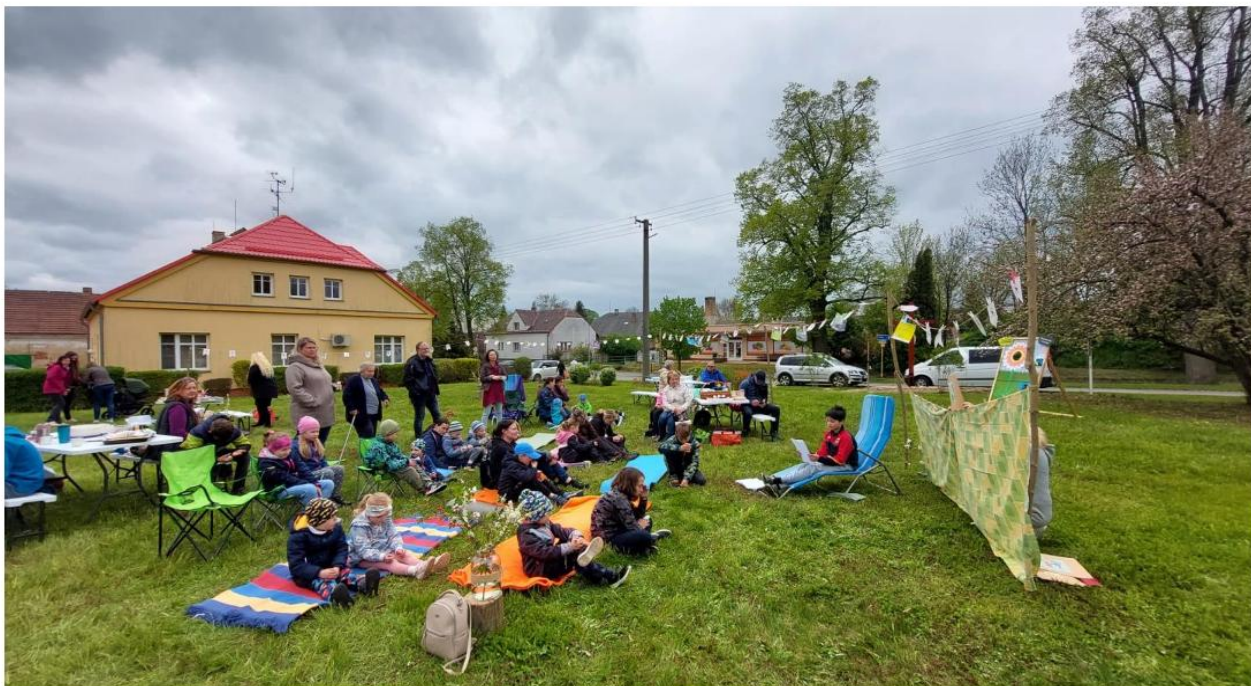
Foto: Férová snídaně 13. 5. 2023

Všechny srdečně zveme a těšíme se na společnou rozmluvu, ochutnávku vašich dobrot, sdílení receptů a rad pro pečení, vaření či jen míchání a kombinování chutí!