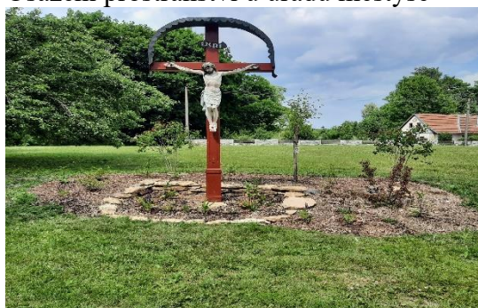
Osázení prostranství u úřadu městyse